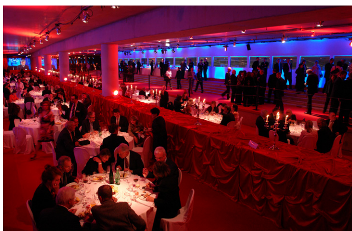
Ort der Abendveranstaltung Evening reception U3 TUNNEL Potsdamer Platz 1, D-10785 Berlin